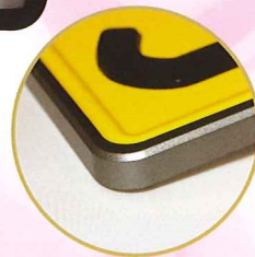
シルバーメタリック飾り枠