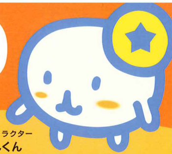
マスコットキャラクター だいあもんくん