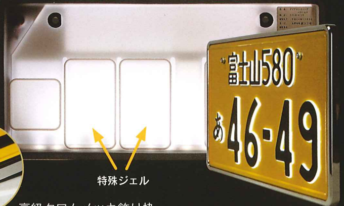
高級クロムメッキ飾り枠

※旭化成テクノプラスの製品はすべて国内で生産されています。※字光式ナンバープレートは各都道府県の軽自動車ナンバープレート発行窓口でお申し込みください。